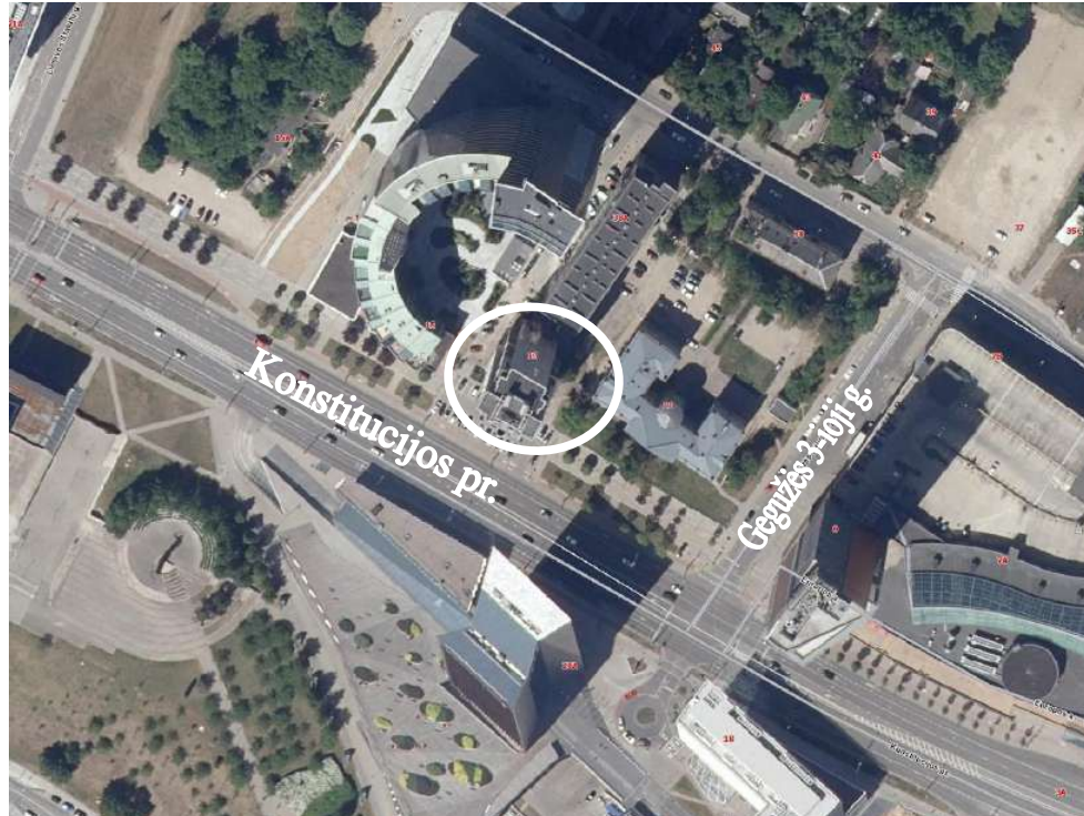
Pav. 1 „Situacijos schema“

Projekto pavadinimas ir adresas: Daugiabučio gyvenamojo namo Vilniaus m., Konstitucijos pr. 13, atnaujinimo (modernizavimo) projektas.